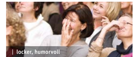
| locker, humorvoll